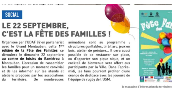
Article du journal « Ma ville » de septembre 2019.

Cette action a été relayée dans la presse, en amont et en aval de l'évènement.