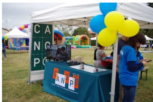
Animation numérique avec des robots