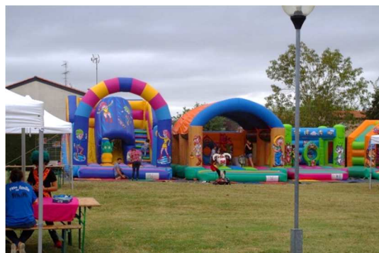
Les structures gonflables

L'objectif qui était de rassembler toutes les familles autour d'un moment convivial et festif a été largement atteint, et ce, malgré une météo peu accueillante !