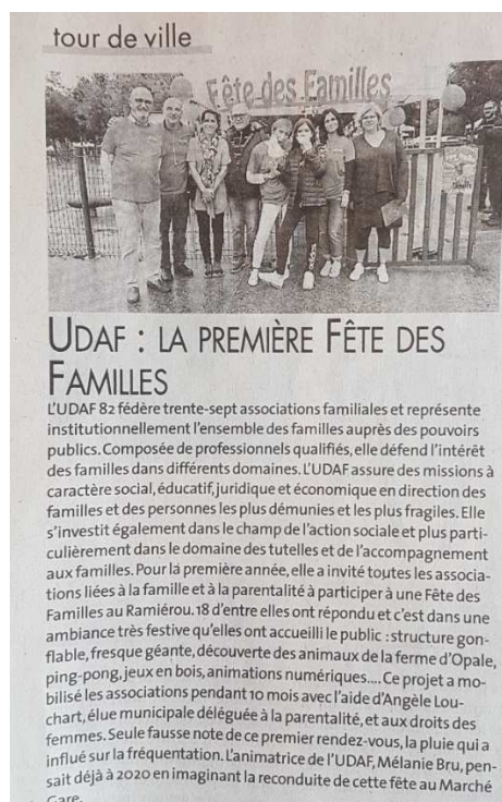
Articles journal de « La Dépêche » du 25/09/20

LA PROCHAINE EDITION DE LA FETE DES FAMILLES DE 2020 EST DEJA EN COURS DE PREPARATION !!