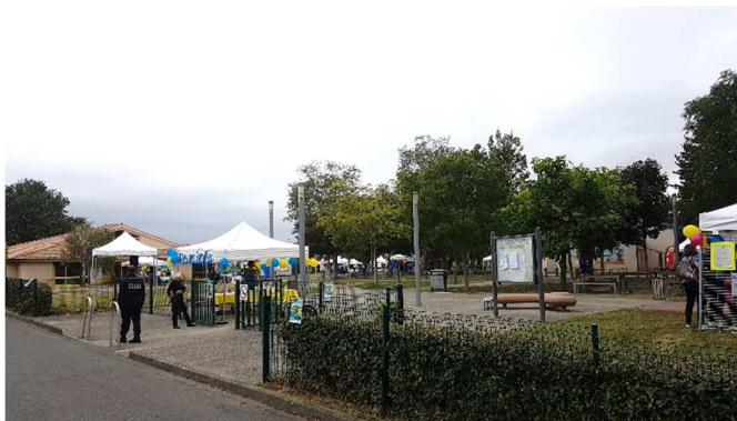
Installation des stands au Centre de Loisirs du Ramierou