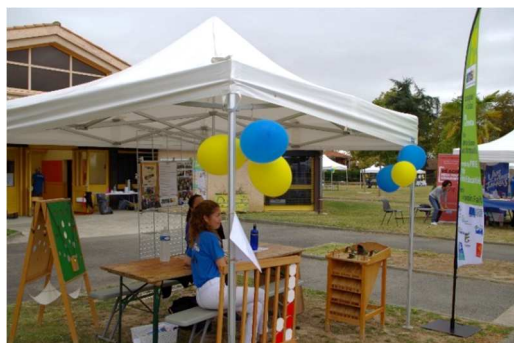
Animation de jeux en bois